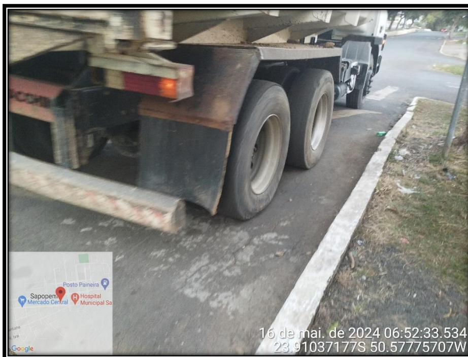
Imagem 16 – Avenida Manuel Ribas, sentido Rodovia PR 090.