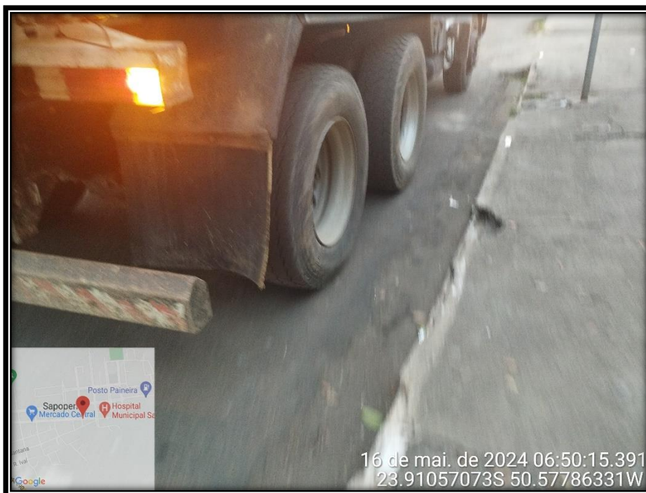
Imagem 13 – Final da Avenida Manuel Ribas, sentido Centro.

Av. Manoel Ribas, 818 – CEP: 84.290-000 Fone/Fax: (43) 3548-1383 - Sapopema - PR www.sapopema.pr.gov.br