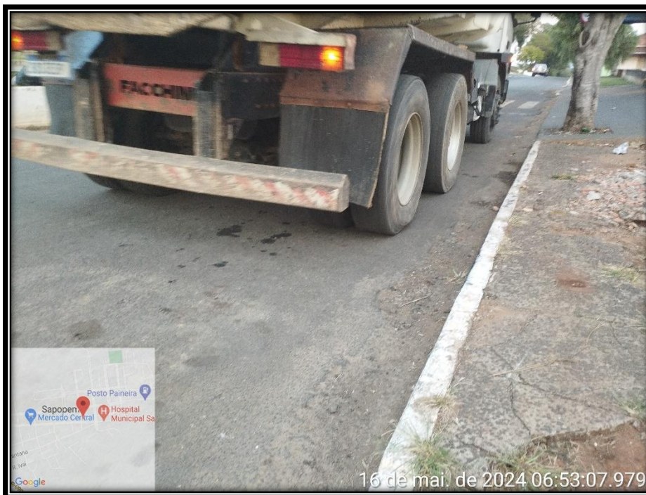
Imagem 17 – Avenida Manuel Ribas, sentido Rodovia PR 090.