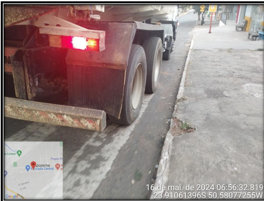
Imagem 23 – Avenida Manuel Ribas, sentido Rodovia PR 090.

Av. Manoel Ribas, 818 – CEP: 84.290-000 Fone/Fax: (43) 3548-1383 - Sapopema - PR www.sapopema.pr.gov.br