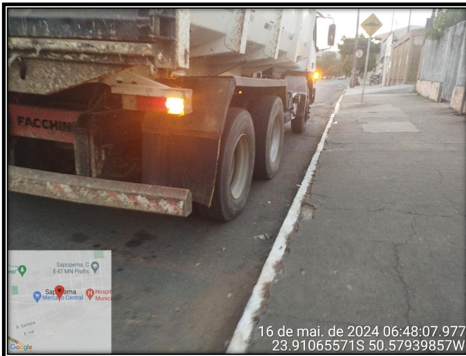
Imagem 09 – Avenida Manuel Ribas, sentido Centro.

Av. Manoel Ribas, 818 – CEP: 84.290-000 Fone/Fax: (43) 3548-1383 - Sapopema - PR www.sapopema.pr.gov.br