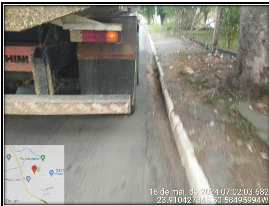
Imagem 27 – Avenida Manuel Ribas, sentido Rodovia PR 090.

Av. Manoel Ribas, 818 – CEP: 84.290-000 Fone/Fax: (43) 3548-1383 - Sapopema - PR www.sapopema.pr.gov.br