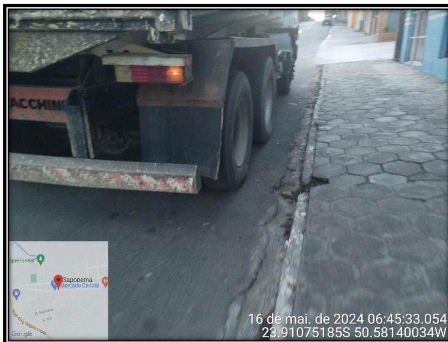
Imagem 03 – Avenida Manuel Ribas, sentido Centro.