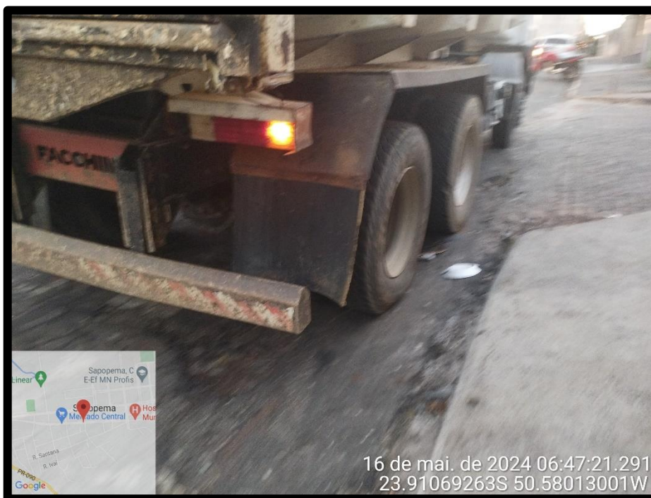
Imagem 07 – Avenida Manuel Ribas, sentido Centro.

Av. Manoel Ribas, 818 – CEP: 84.290-000 Fone/Fax: (43) 3548-1383 - Sapopema - PR www.sapopema.pr.gov.br