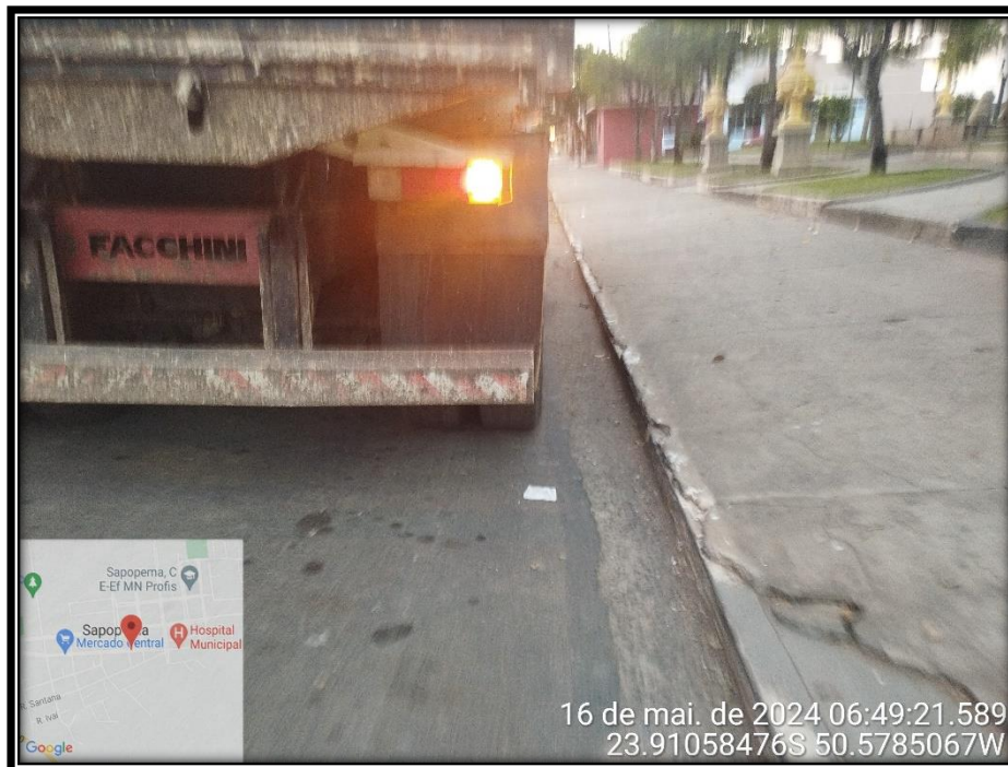
Imagem 11 – Avenida Manuel Ribas, sentido Centro.

Av. Manoel Ribas, 818 – CEP: 84.290-000 Fone/Fax: (43) 3548-1383 - Sapopema - PR www.sapopema.pr.gov.br