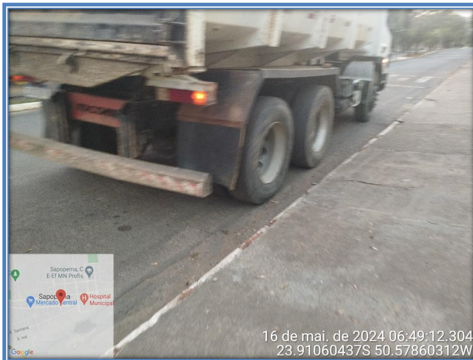
Imagem 10 – Avenida Manuel Ribas, sentido Centro.