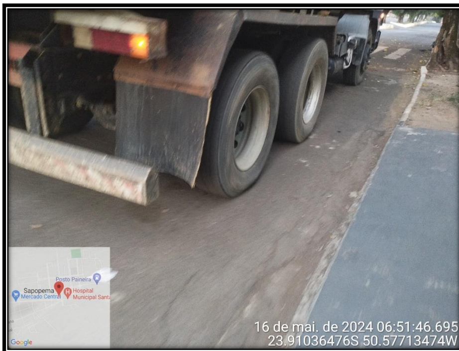
Imagem 15 – Avenida Manuel Ribas, sentido Rodovia PR 090.

Av. Manoel Ribas, 818 – CEP: 84.290-000 Fone/Fax: (43) 3548-1383 - Sapopema - PR www.sapopema.pr.gov.br