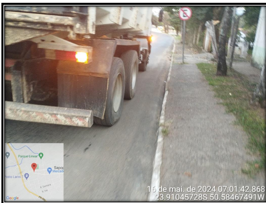
Imagem 26 – Avenida Manuel Ribas, sentido Rodovia PR 090.