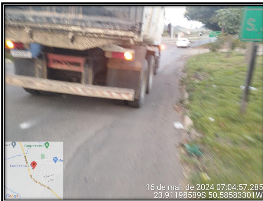
Imagem 28– Final - Avenida Manuel Ribas, sentido Rodovia PR 090.