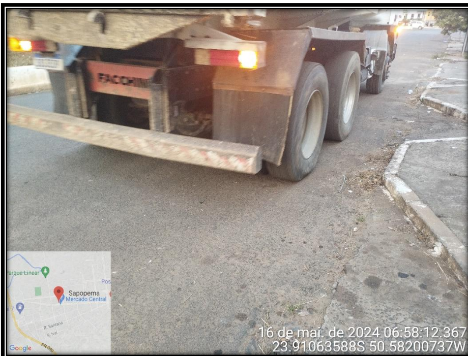
Imagem 24 – Avenida Manuel Ribas, sentido Rodovia PR 090.