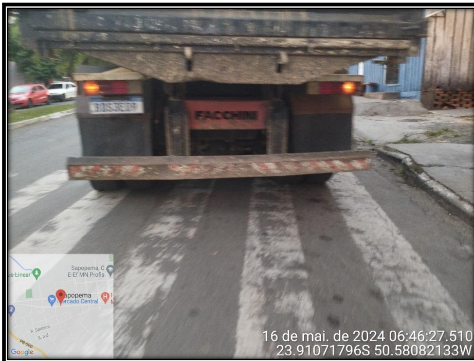
Imagem 06 – Avenida Manuel Ribas, sentido Centro.