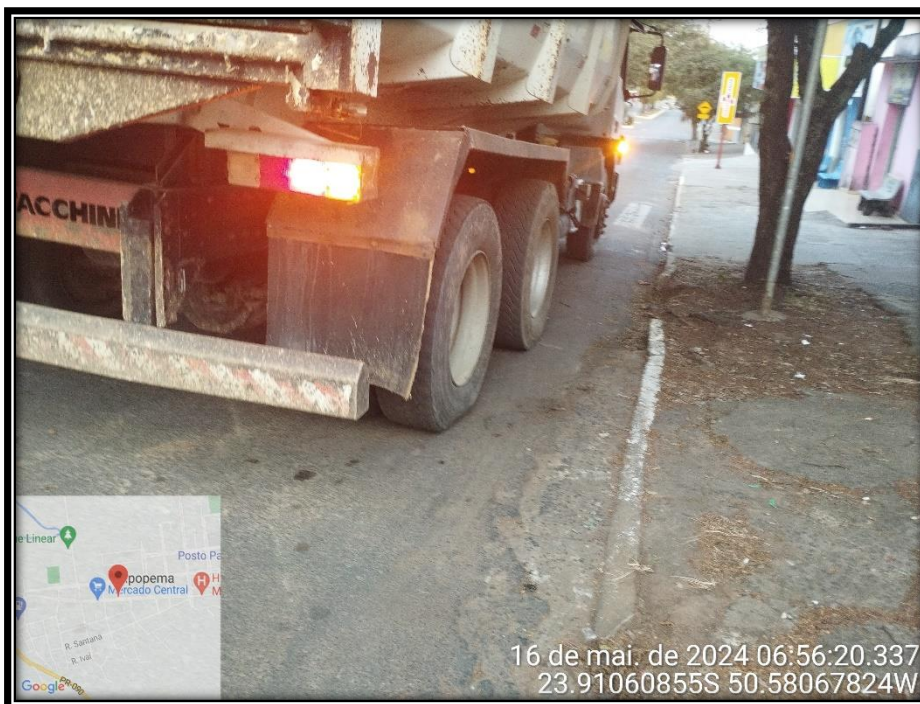
Imagem 22 – Avenida Manuel Ribas, sentido Rodovia PR 090.