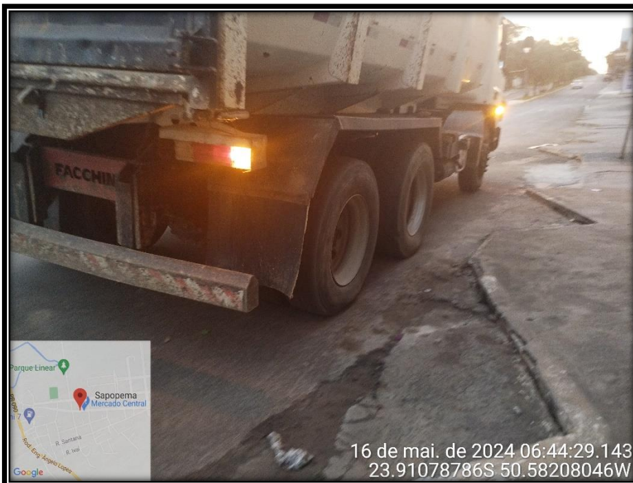
Imagem 02 – Avenida Manuel Ribas, sentido Centro.