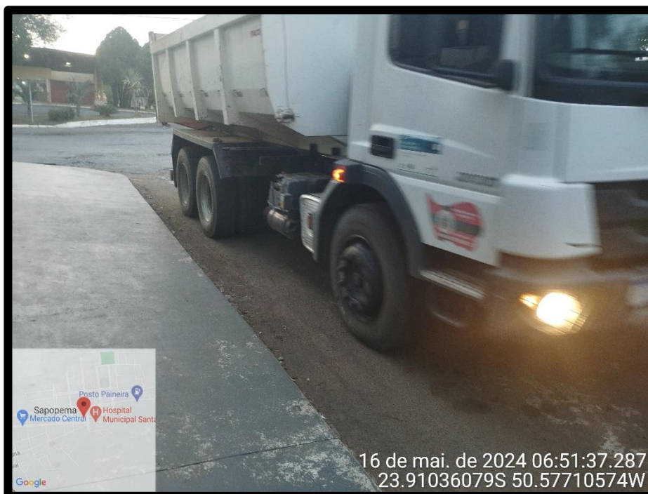
Imagem 14 – Início da Avenida Manuel Ribas, sentido Rodovia PR 090.