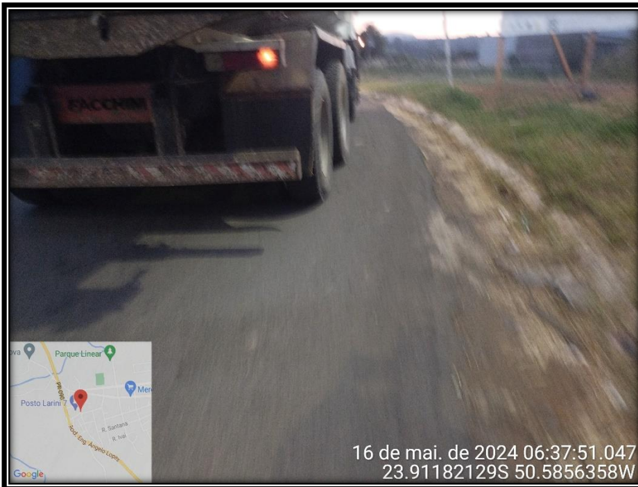
Imagem 01 – Início da Avenida Manuel Ribas, sentido Centro.