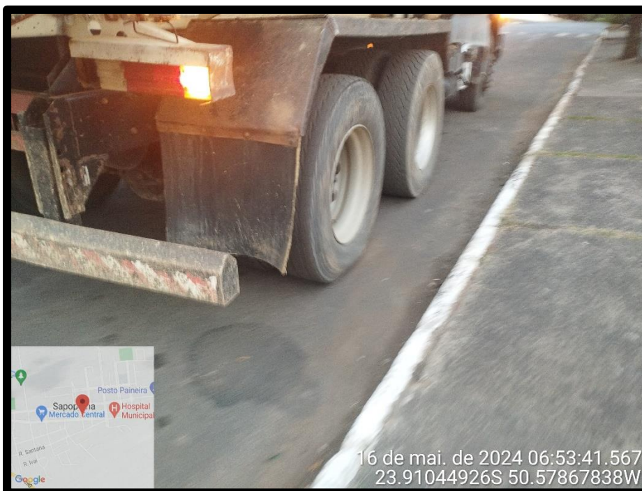
Imagem 18 – Avenida Manuel Ribas, sentido Rodovia PR 090.