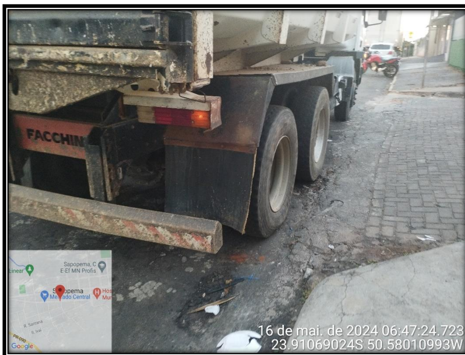
Imagem 08 – Avenida Manuel Ribas, sentido Centro.