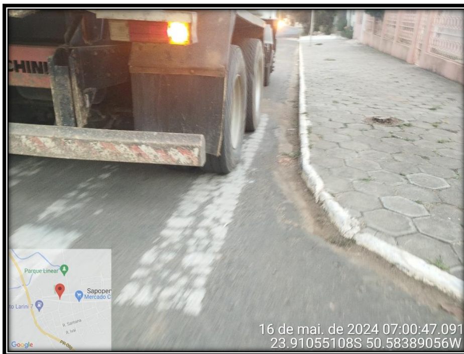
Imagem 25 – Avenida Manuel Ribas, sentido Rodovia PR 090.

Av. Manoel Ribas, 818 – CEP: 84.290-000 Fone/Fax: (43) 3548-1383 - Sapopema - PR www.sapopema.pr.gov.br