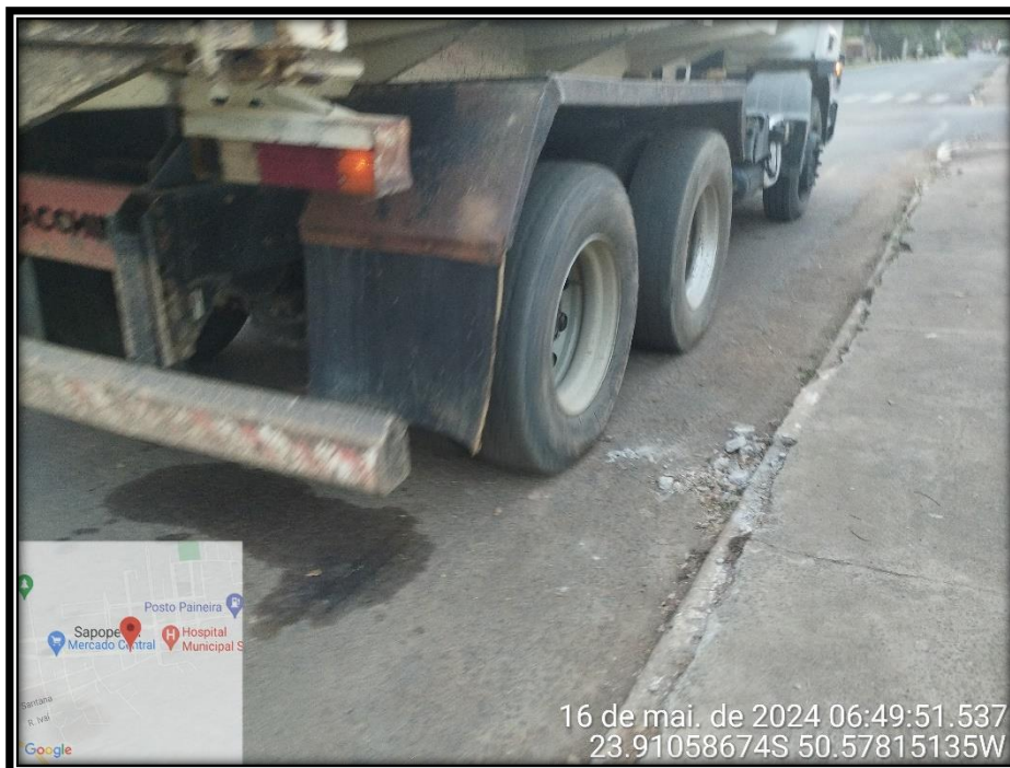
Imagem 12 – Avenida Manuel Ribas, sentido Centro.