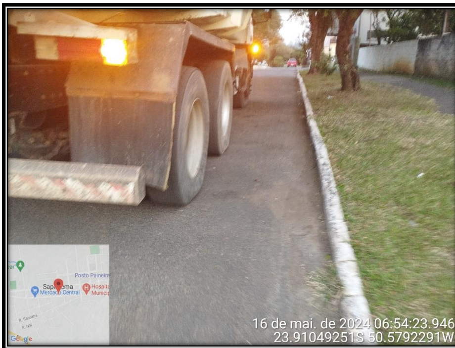
Imagem 19 – Avenida Manuel Ribas, sentido Rodovia PR 090.

Av. Manoel Ribas, 818 – CEP: 84.290-000 Fone/Fax: (43) 3548-1383 - Sapopema - PR www.sapopema.pr.gov.br