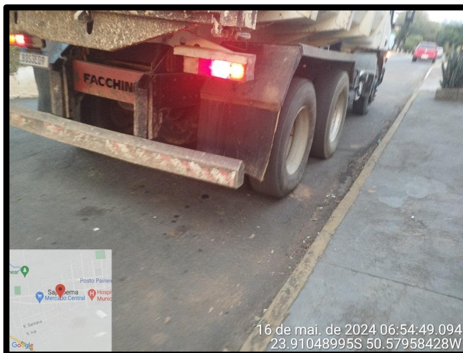
Imagem 20 – Avenida Manuel Ribas, sentido Rodovia PR 090.