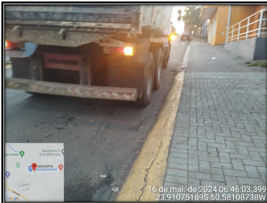
Imagem 05 – Avenida Manuel Ribas, sentido Centro.