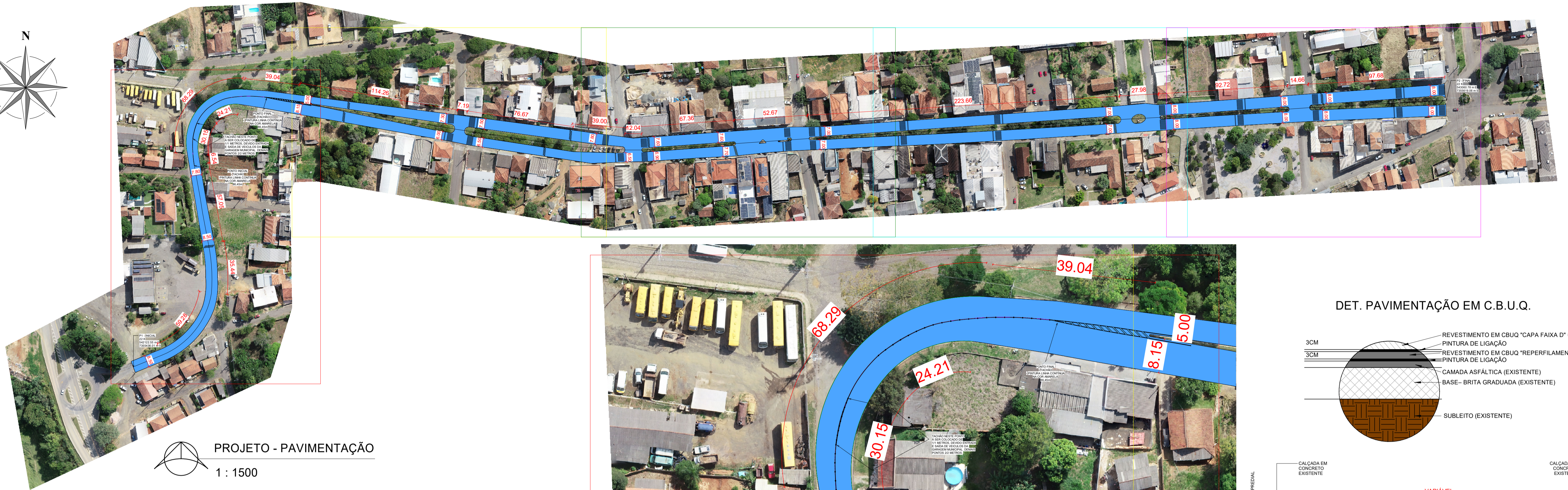
PROJETO - PAVIMENTAÇÃO 1 : 1500