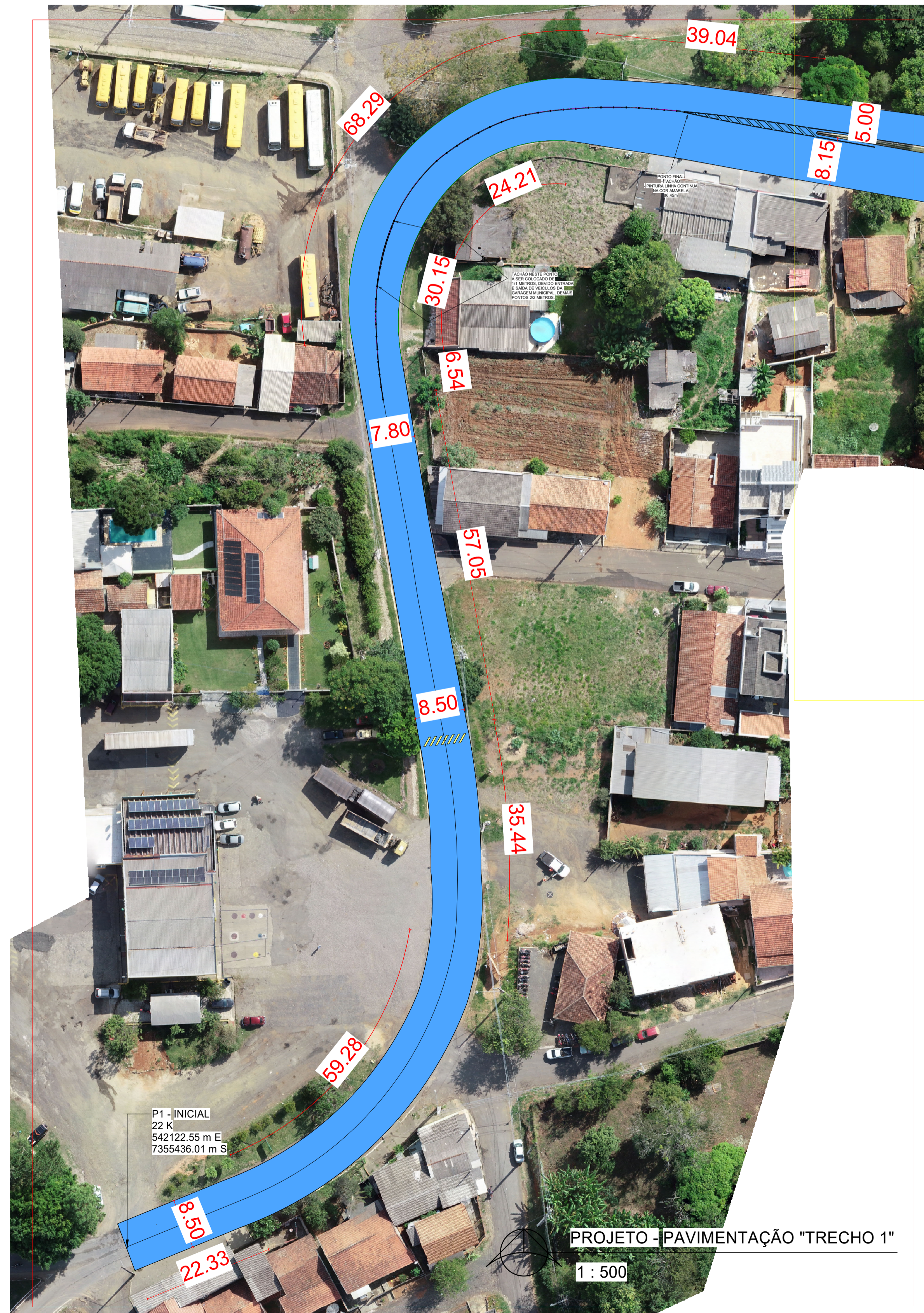
PROJETO - PAVIMENTAÇÃO "TRECHO 1" 1 : 500