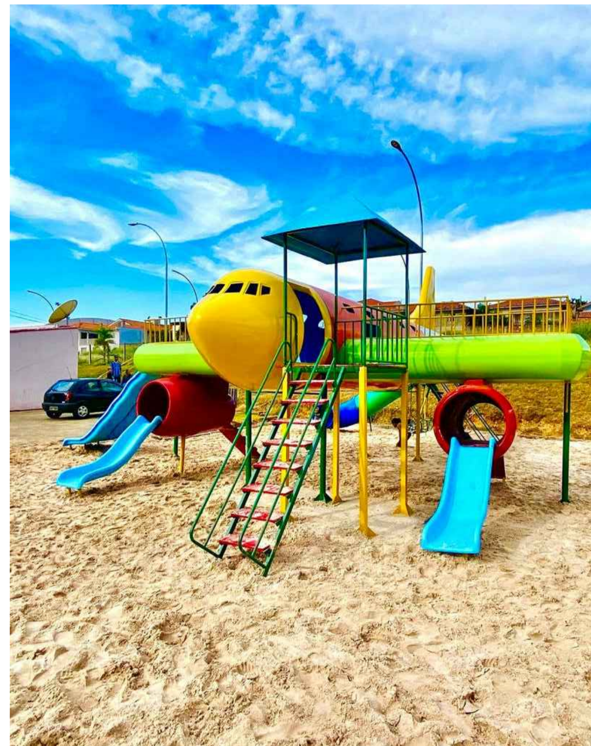
VISTAS IMAGENS MERAMENTE ILUSTRATIVAS