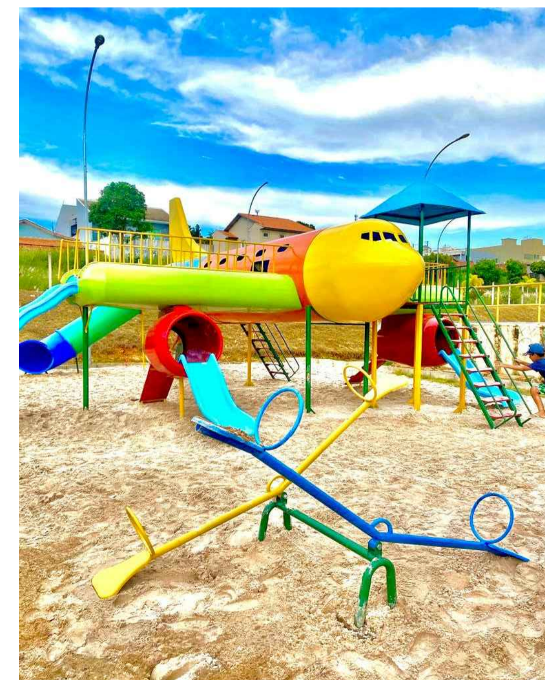
VISTAS IMAGENS MERAMENTE ILUSTRATIVAS