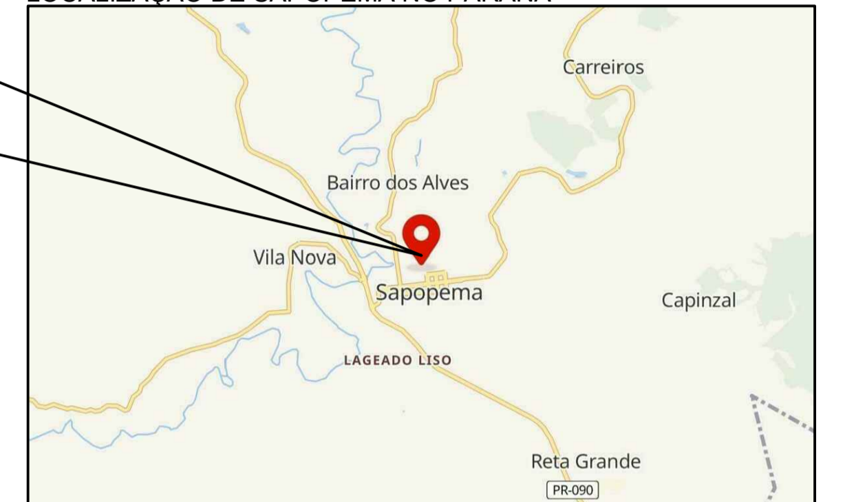
LOCALIZAÇÃO DO PARQUE EM SAPOPEMA