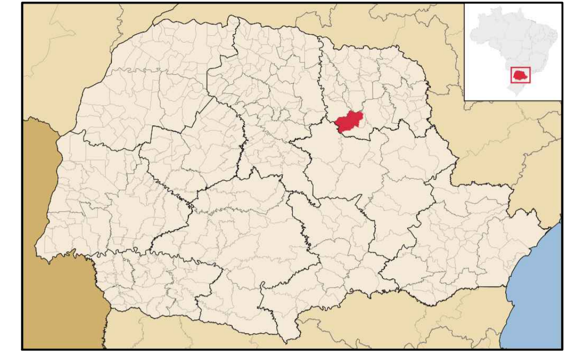
LOCALIZAÇÃO DE SAPOPEMA NO PARANÁ