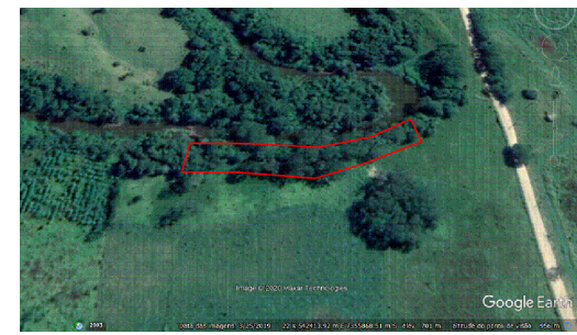
Polígono demarcando área de preservação permanente (APP).