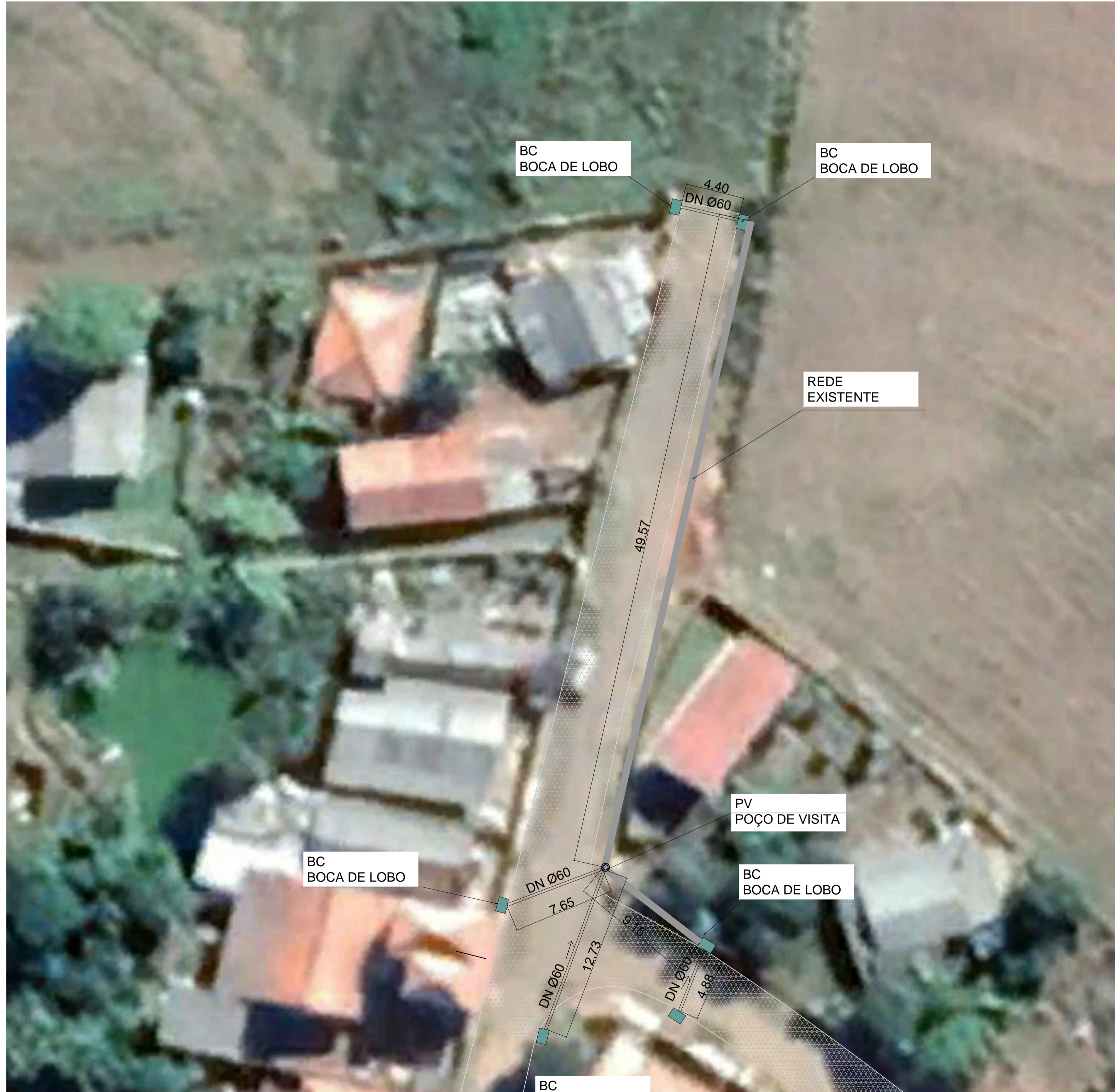
PROJETO DE DRENAGEM ESCALA 1/200