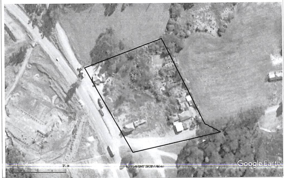
IMAGEM DE LOCALIZAÇÃO - S/ESCALA

A DECLINAÇÃO MAGNÉTICA CRESCER -7,50' ANUALMENTE Usar exclusivamente os dados numéricos