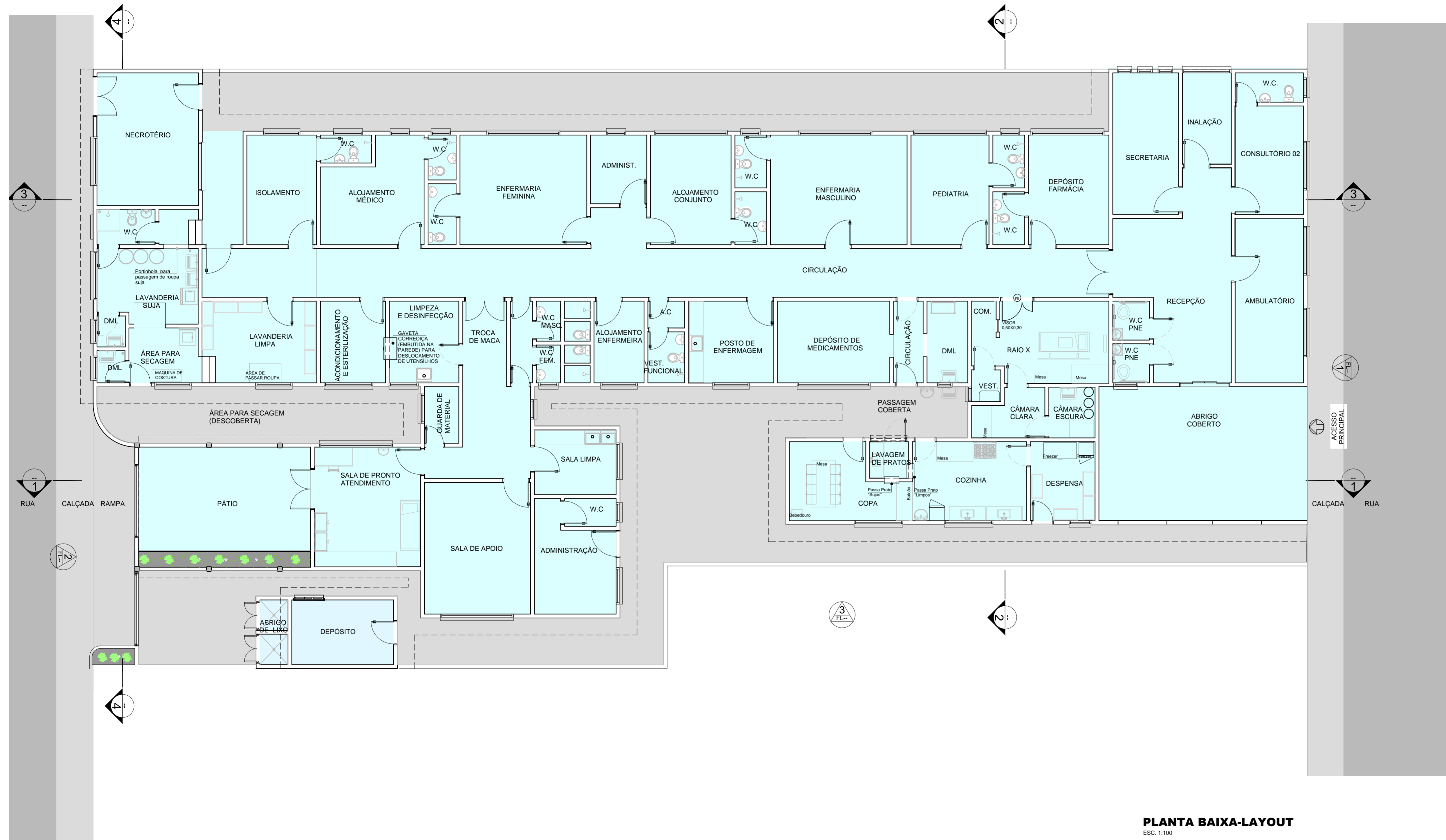
PLANTA BAIXA-LAYOUT ESC. 1:100