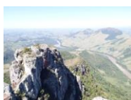
Paulo Maximiano de Souza Júnior Prefeito Municipal