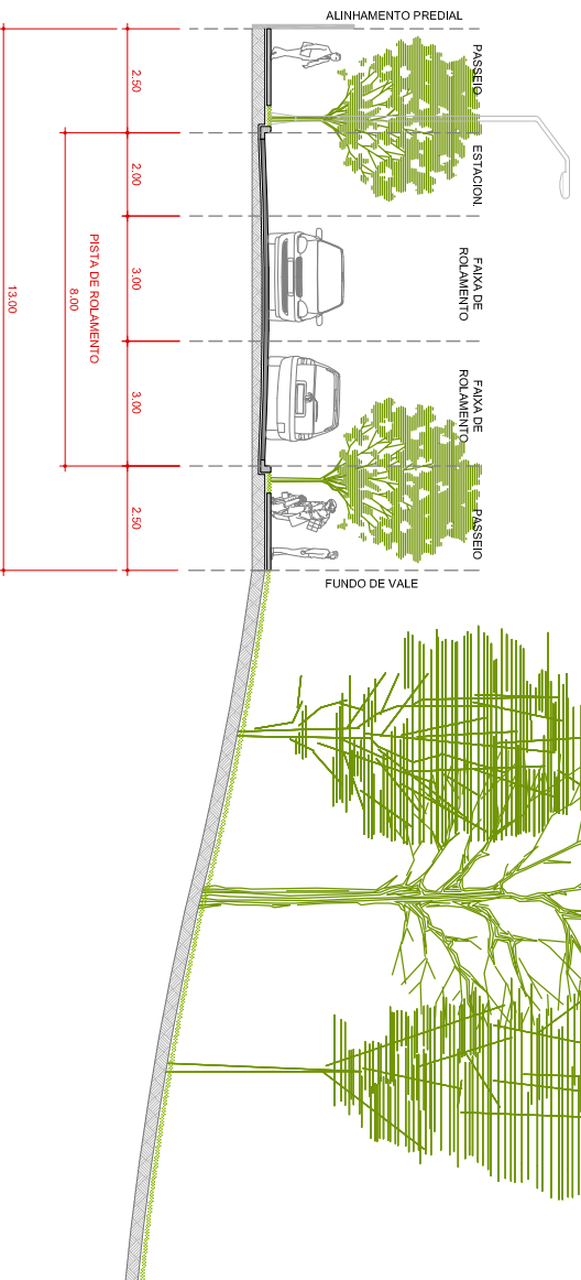
PERFIL VIA MARGINAL DE FUNDO DE VALE 0,00m 0 2,00m 4,00m 20m 30m ESCALA GRAFICA

Município com localização da área urbana